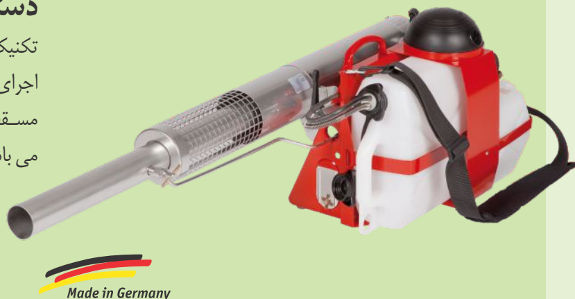
Made in Germany

تکنیک مه پاشی شیوه ای پیشرفته و راه حلی مناسب برای اجرای عملیات سمپاشی ، ضد عفونی و یا گندزدایی در اماکن مسقف و یا فضای باز با استفاده از حداقل محلول مورد نظر می باشد ، به نحویکه حتی در محل هایی که دسترسی به آنها امکان پذیر نیست ، مواد مؤثر محلول به صورت یکسان توزیع شده بدون آنکه از خود بقایای نامطلوب برجای گذارد که در نهایت سبب کار عملیاتی کمتر و همچنین صدمات کمتری به محیط زیست می شود .